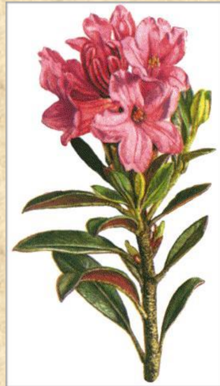
La miel y la savia del rododendro son usados en Gaidil como potentes venenos

VUELVE EL GRUPO DE EXPLORACIÓN ACOMPAÑADOS DE GUERREROS DE GÁIDIL, OCURRE EXACTAMENTE IGUAL QUE EN LLIÓN, POR CIERTO, SIGUE LLOVIENDO.